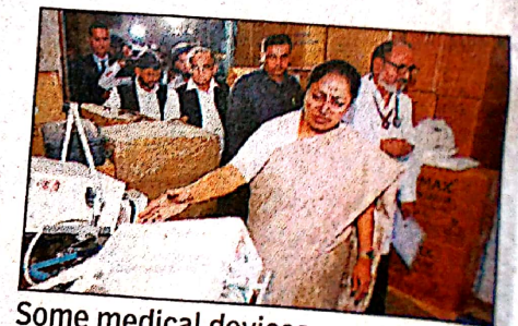
Some medical devices were stored without proper covers, the CM said

New Delhi: Chief minister Rekha Gupta on Tuesday criticised the state of Delhi's healthcare under AAP govt, labelling it "zero", and stating the previous administration rendered the entire system "non-functional", leaving patients unable to access necessary medical